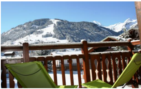
Du balcon vers village et piste du Grand Mont