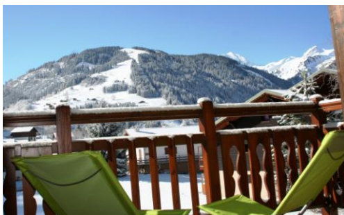
Du balcon vers village et piste du Grand Mont