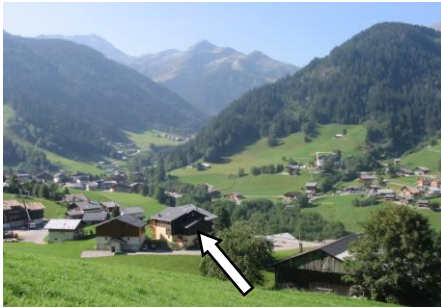
Belle vue expo sud, sur village et sommets.