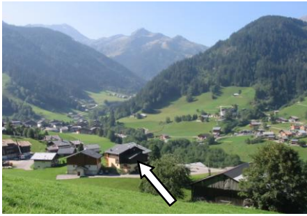
Belle vue expo sud, sur village et sommets.